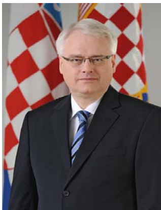
Ivo Josipović, Président croate, élu le 18 février 2010

Au niveau étatique : Le président de la République est le chef de l'Etat ainsi que le chef des armées. Il nomme le chef du gouvernement en accord avec l'Assemblée. Il est élu pour 5 ans au suffrage universel direct. Le gouvernement a à sa tête un chef du gouvernement ainsi que deux vice-présidents, qui dirigent une équipe de 13 ministres.