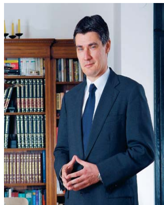
Zoran Milanović, chef du gouvernement depuis le 23 décembre 2011